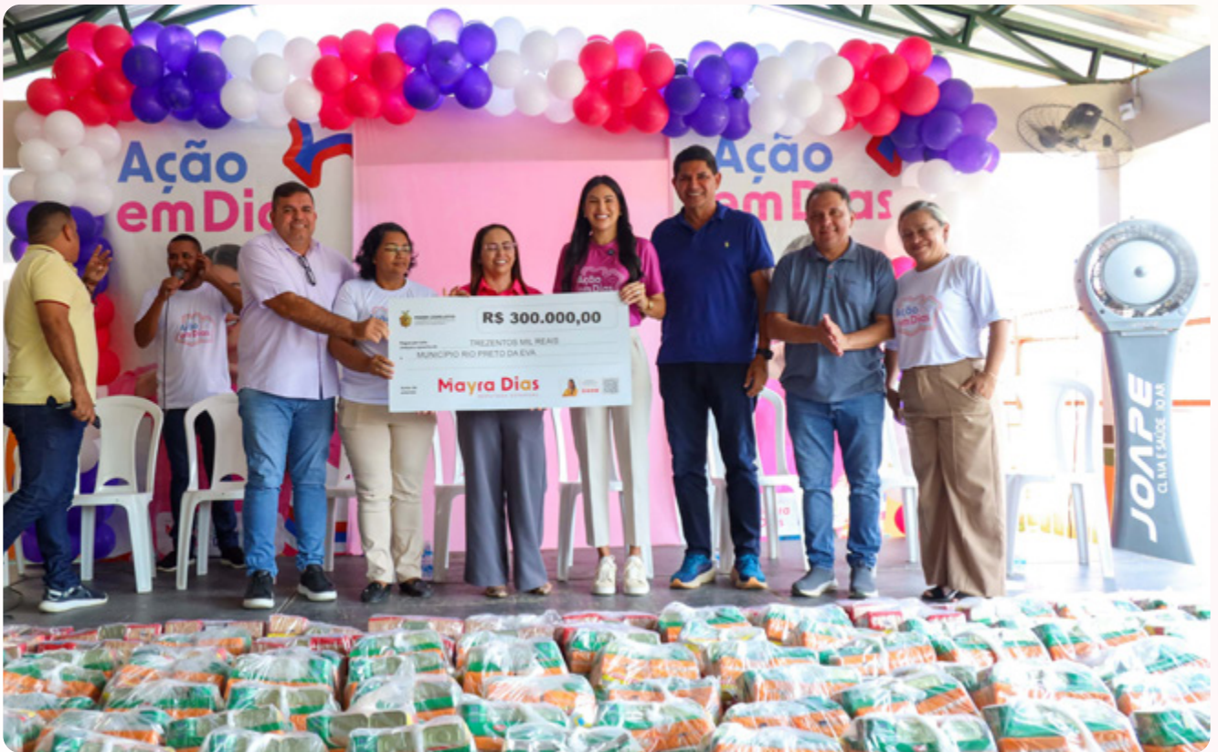
R$ 500 mil em emendas para reforçar saúde e assistência social em Rio Preto da Eva.