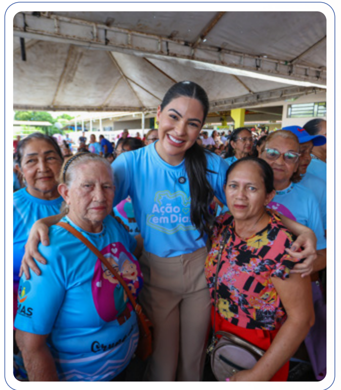
Mayra Dias destinou recursos para a construção do Centro do Idoso em Nhamundá.

Por meio de emenda ao Fundo Estadual de Assistência Social (FEAS), a deputada estadual Mayra Dias destinou R$ 1,5 milhão na construção do Centro do Idoso de Nhamundá. O investimento representa mais que a edificação de um espaço físico, é um gesto de respeito, responsabilidade e cuidado com quem ajudou a construir a história do município. O futuro Centro do Idoso será um ambiente pensado para oferecer apoio, acolhimento e serviços essenciais à população idosa, promovendo bem-estar, convivência, inclusão e uma vida ativa e saudável. A proposta contempla atividades socioculturais, atendimentos especializados e espaços de integração, reforçando o direito de envelhecer com dignidade. “Cuidar dos nossos idosos é garantir um presente mais justo e um futuro mais humano para todos”, afirma a deputada.